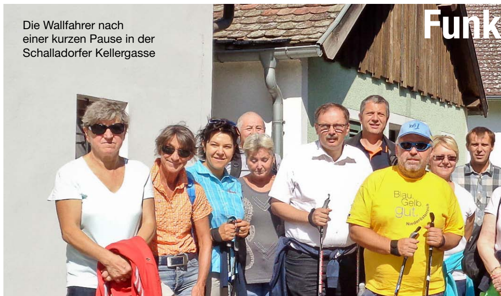
Die Wallfahrer nach einer kurzen Pause in der Schalladorfer Kellergasse